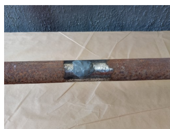
Massa epóxi aplicada