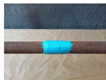
KIT de reparo aplicado