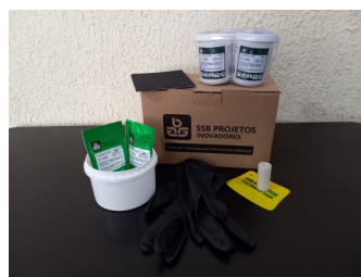
KIT de reparo SSB 5-150