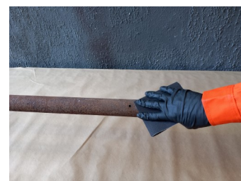
Exemplo de tratamento manual