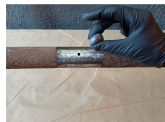
Aplicação da massa epóxi