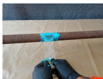
Tensionamento do tecido