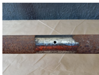
Aspecto final do tratamento