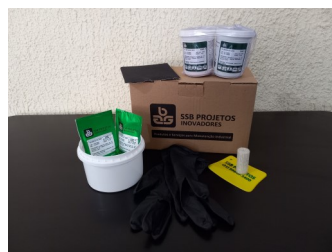
KIT de reparo SSB