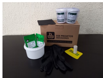
KIT de reparo SSB 5-150