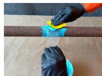
Aplicação do sistema de laminação no tecido