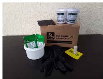
KIT de reparo SSB 5-150