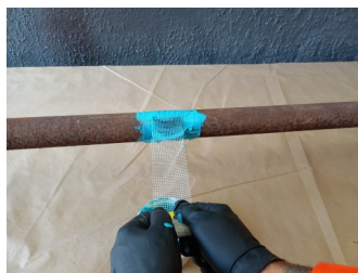
Tensionamento do tecido