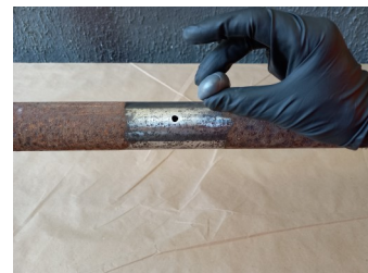
Aplicação da massa epóxi