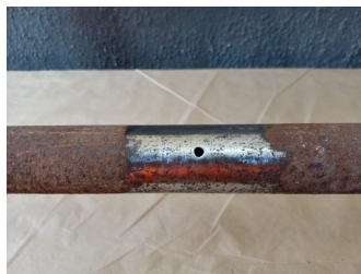
Aspecto final do tratamento