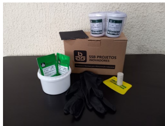
KIT de reparo SSB 5-150